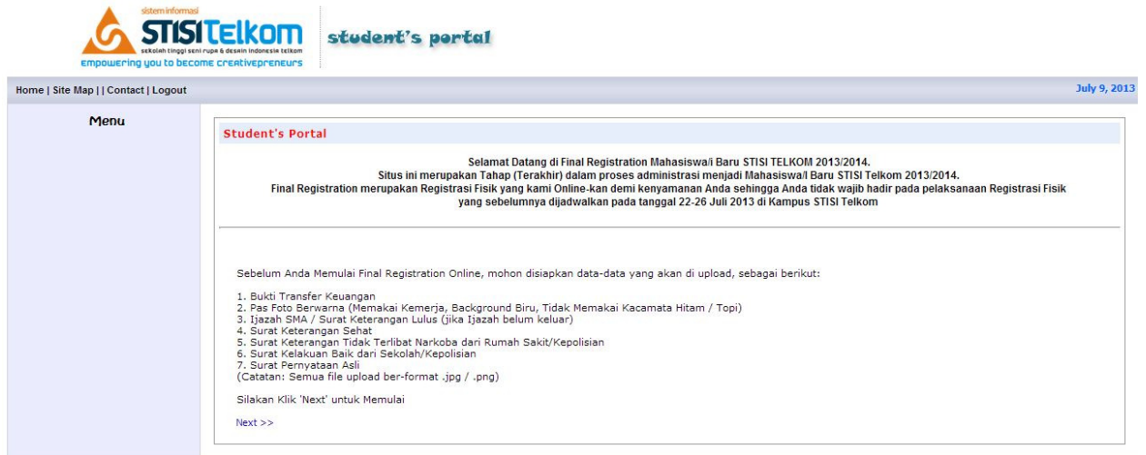
Gambar 1.2 Tampilan Menu Final Registration Online